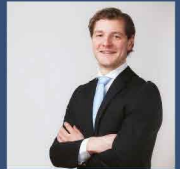
Noud Wijtenburg Construction Management and Engineering